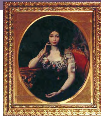
Ritratto della Baronessa Olimpia Savio dipinto da Bice Morgari Vezzetti nel 1858.

Nel suo salotto e nella villa di Millerose alla periferia della città ruotano le figure più interessanti, che Olimpia descrive e annota non solo nelle sue memorie, ma anche in molti articoli su giornali e riviste. Nel 1837 (6 giugno) nasce Emilio e nel 1838 (13 settembre) Alfredo; entrano entrambi all'Accademia Militare di Torino e ne escono con il grado di sottotenente di artiglieria; partecipano alla seconda guerra