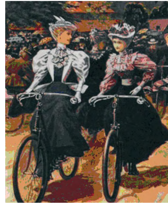
Figurino inglese del 1895 - Le ragazze im bicicletta

Lei aveva provato a salire su quello strano attrezzo, ma era caduta e si era fatta male. Da quel 1° novembre 1868 il velocipede l'aveva entusiasmata. Ancora bambina, aveva letto sul giornale la notizia di quel giorno: era domenica e sulla pista di Bordeaux (sempre la Francia che continuava a dettare legge) si era disputata la prima