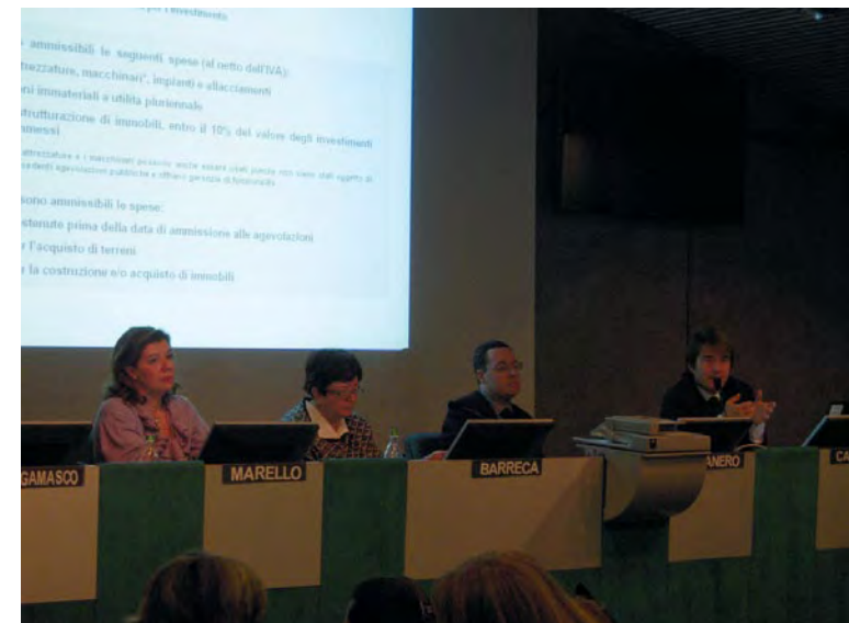
Un momento informativo della scorsa edizione