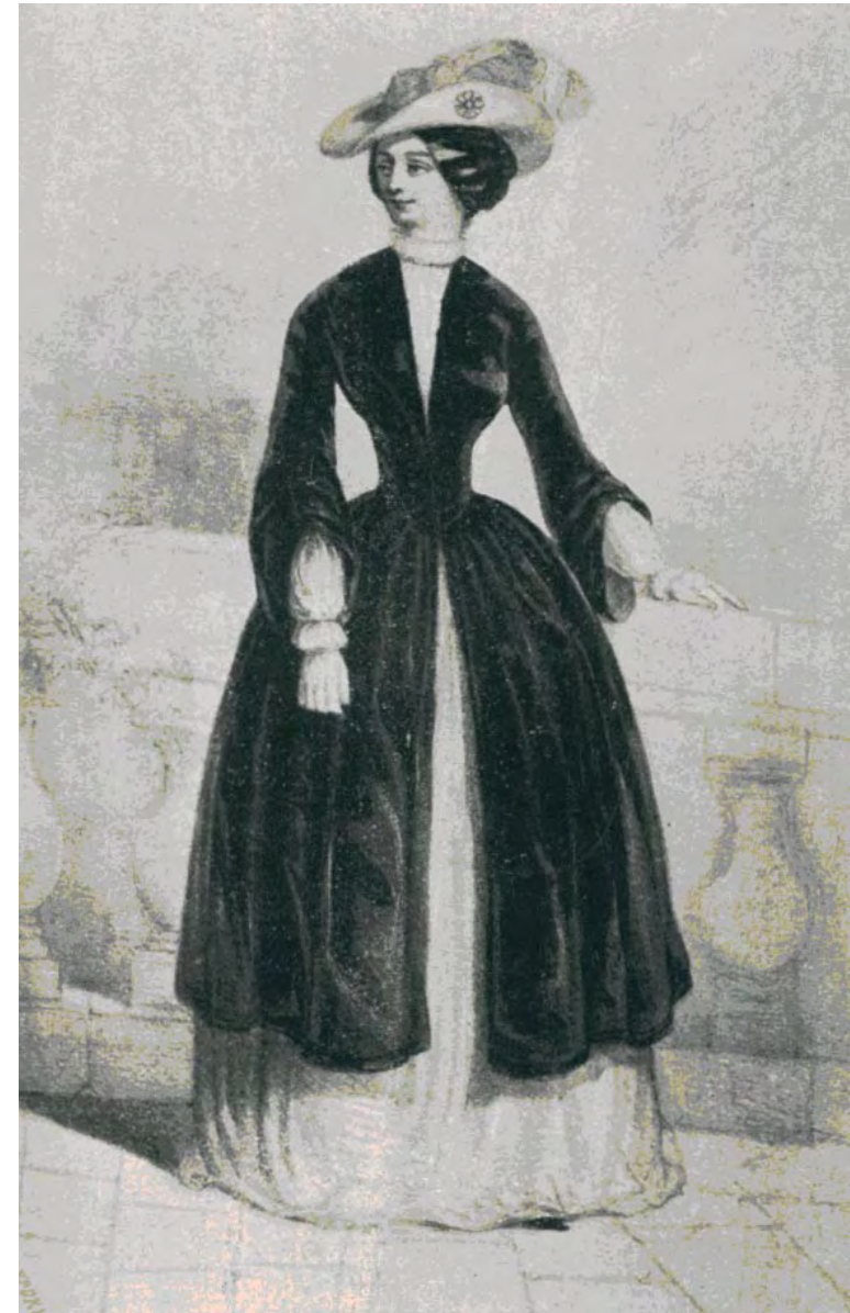
Figurino presentato nel salotto di Costanza d'Azeglio per il vestito nazionale.