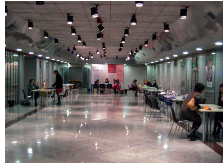
L'attività degli sportelli

Per maggiori informazioni www.promopoint.to.camcom.it/iniziativa