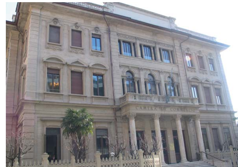
Sede della Camera di commercio di Cuneo