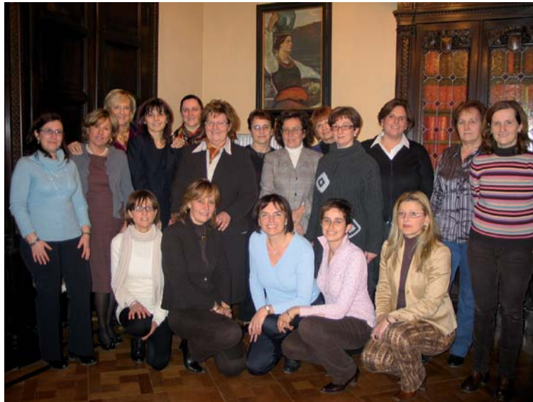
Comitati per la promozione dell'imprenditoria femminile di Cuneo