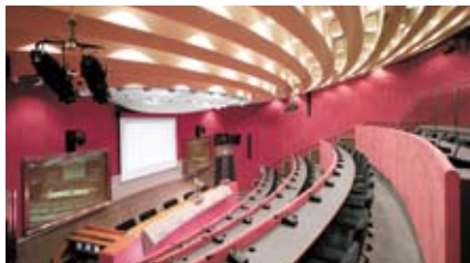
Centro Congressi Torino Incontra

Il 12 giugno scorso è stato organizzato, presso il Centro Congressi Torino Incontra, un convegno finalizzato a delineare il panorama del mondo lavorativo femminile e presen-